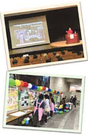
※写真はさんかくフェスタ2023の様子