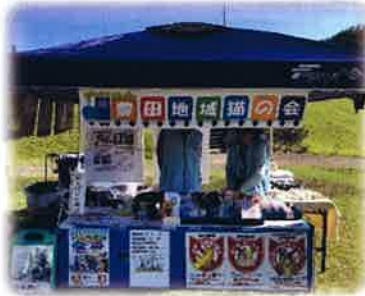
(左写真) 動物愛護活動イベントで自活動のPRもします。