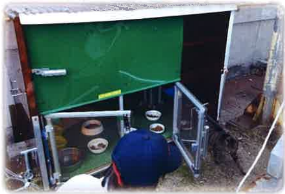
トヨタ自動車(株)工場内に設置されている「猫ハウス」です。ここには13匹の地域猫が餌を食べ寝泊まりしています。

地域猫活動の普及と定着支援をしています。具体的には各種イベントでの地域猫活動のPRや地域猫の不妊手術と給餌(きゅうじ)やトイレの管理に取り組む住民ボランティアに対するアドバイスなどを行っています。