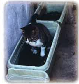
(上写真) 屋外に設置したトイレで用を足す姿。

飼い主のいない猫を放置せず地域で意見交換をして出来るだけ多くの合意を得ながら見守り管理する活動です。