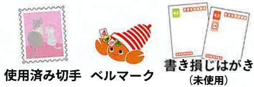
使用済み切手 ベルマーク 書き損じはがき (未使用)

豊田市福祉センター3階交流コーナー、1階受付付近の回収箱、社協支所・出張所の各窓口で回収しています。