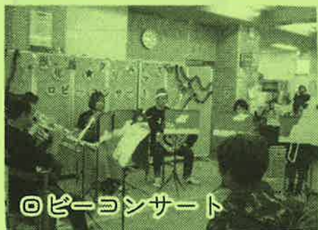
ピアノコンサート