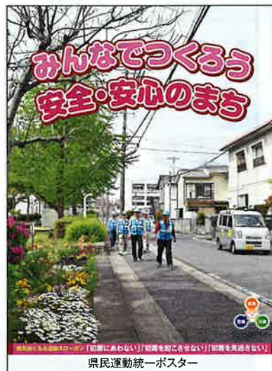
県民運動統一ポスター

この運動は、県民や事業者、団体、市町村の幅広い参加を得て展開し、犯罪被害防止に対する気運を高め、安全で安心して暮らせる社会の実現を目指すものです。