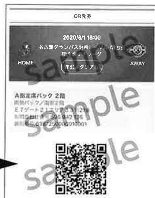
▲QRチケットイメージ画像