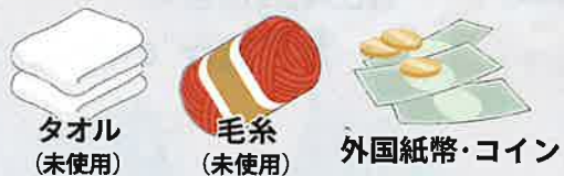
タオル (未使用) 毛糸 (未使用) 外国紙幣・コイン

豊田市福祉センター3階交流コーナー、1階受付付近の回収箱、社協支所・出張所の各窓口で回収しています。